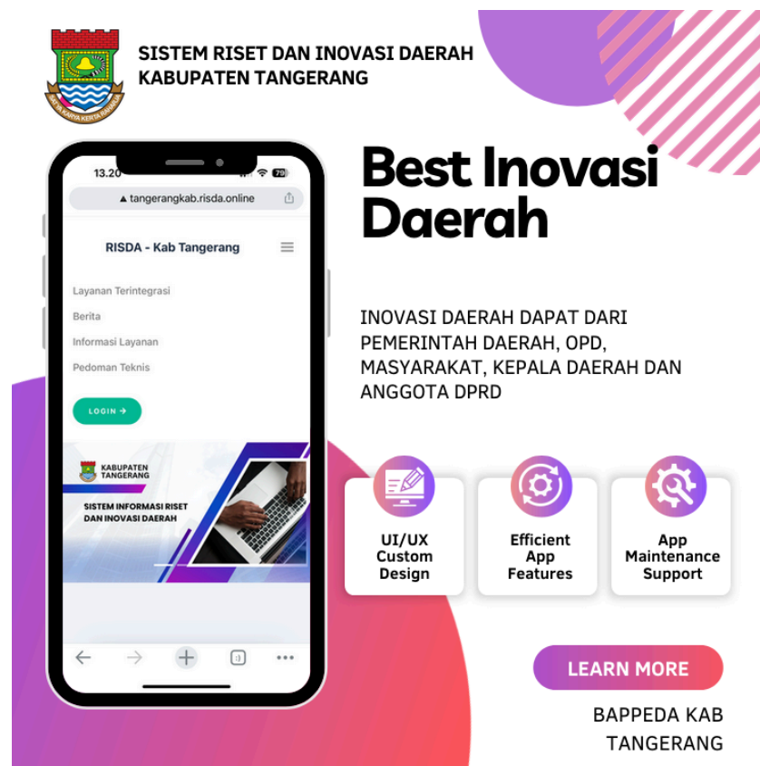
Gambar 1.1 Informasi Layanan di Inovasi Daerah di Kabupaten Tangerang