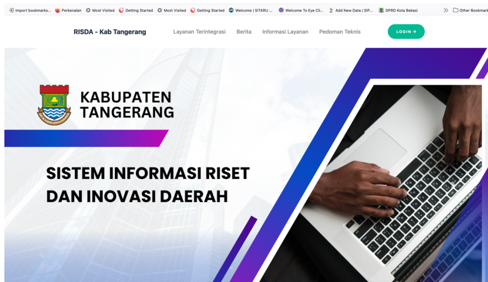
Gambar 2. Layanan Inovasi Daerah berbasis TIK