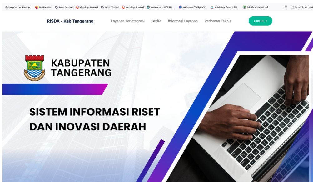
Gambar 2. Layanan Inovasi Daerah berbasis TIK