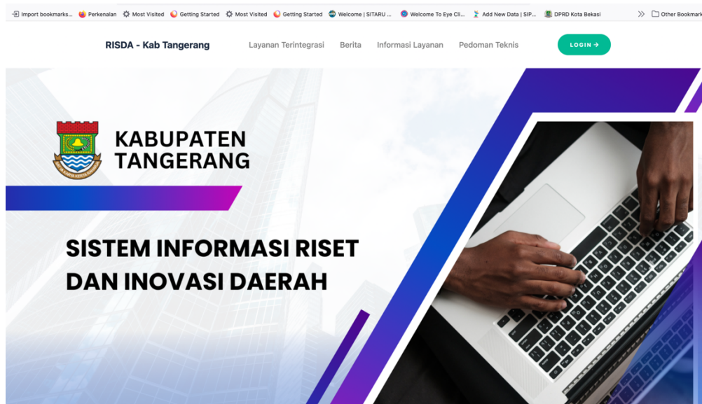
Gambar 2. Layanan Inovasi Daerah berbasis TIK